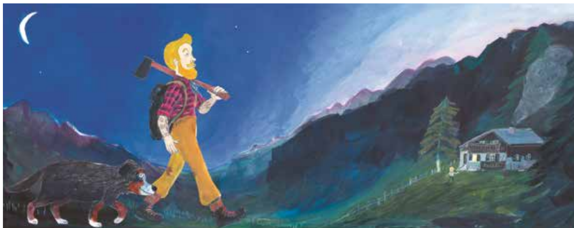
Schicht für Schicht trägt Vera Eggermann die Acrylfarben auf. Die unteren Schichten schimmern durch und tragen damit zur Stimmung bei. © V. Eggermann: Hugo und Kauz. Atlantis 2020.