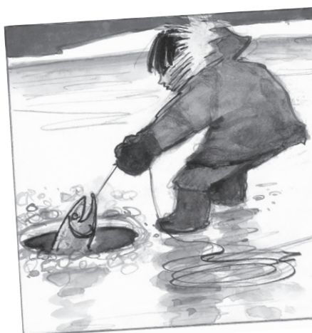
ILLUSTRATION DE LOUIS JOOS POUR LE SOURIRE DE KIAWAK. PASTEL

Le directeur de la Renaissance du Livre m'a donné rendez-vous dans un lieu très chic, à Bruxelles, un hôtel-restaurant. Il m'a