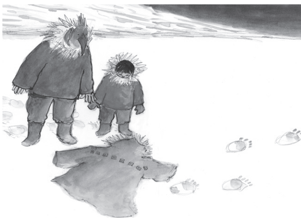
ILLUSTRATION DE LOUIS JOOS POUR ANGAKKED : LA LÉGENDE DE L'OISEAU-HOMME. PASTEL

Livres polaires encore, Le sourire de Kiawak , avec de magnifiques portraits d'enfants, et Le rêve de l'ours où domine un autre de vos thèmes de prédilection: l'opposition de l'ombre et de la lumière, des mondes anciens et du monde moderne... Les scènes nocturnes sont superbes. Et des ours comme héros: il y a beaucoup d'ours dans vos livres!