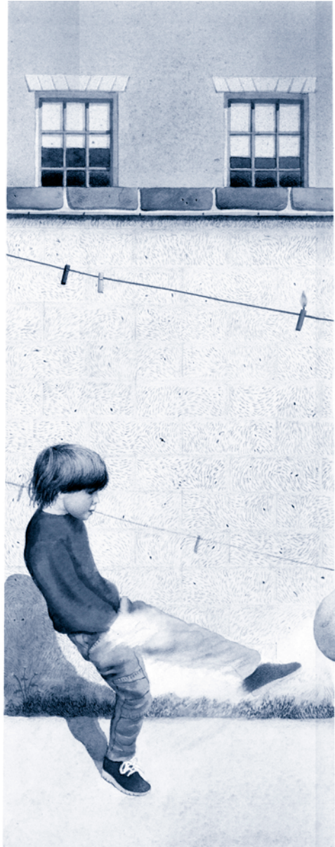
Image de couverture : Anthony Browne ; Tout change ; Kaléidoscope ; 1990