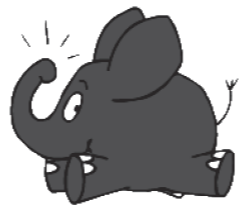
Illustrationen aus «Harry Potter und die Kammer des Schreckens» von Joanne K. Rowling, Carlsen-Verlag, Hamburg und «Der Sendung mit der Maus», WDR-Fernsehen, Köln